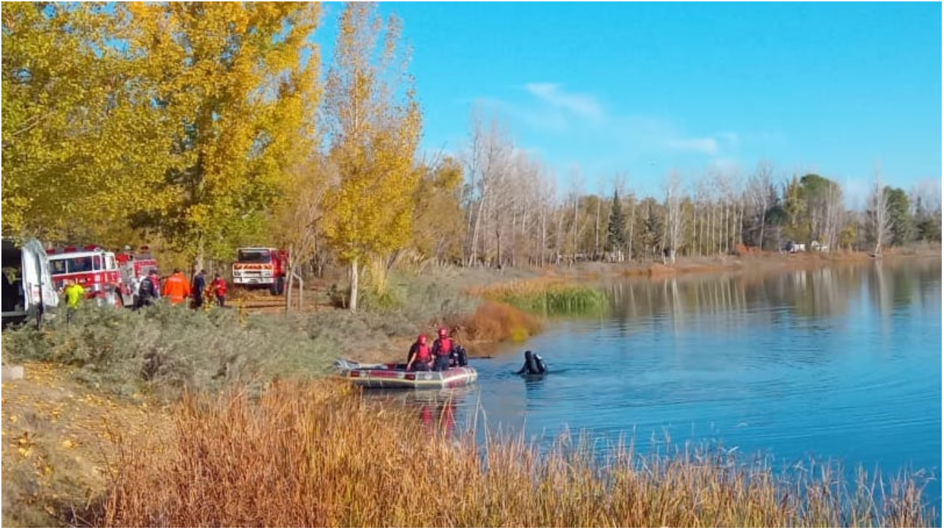
Buzos en el lago de Tunuyán.